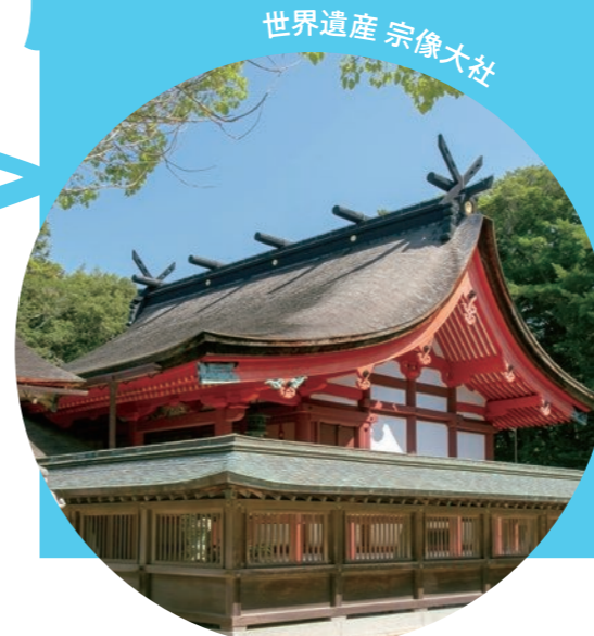
世界遺産 宗像大社