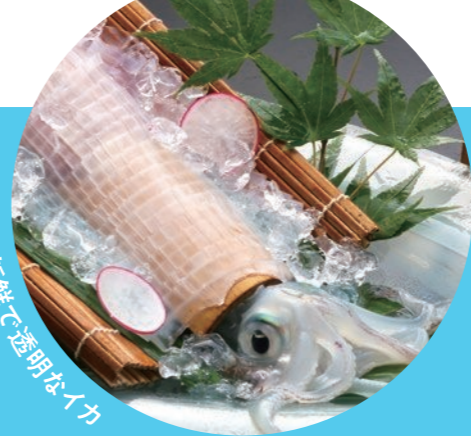
新鮮で透明なイカ