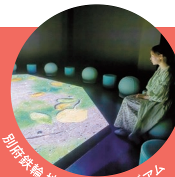
別府鉄輪 地獄温泉ミュージアム