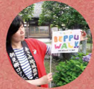
フラッグ片手に案内します。

※いずれのコースも雨天決行ですが、台風などにより中止になる場合もありますので、予めご了承下さい。 ※年末年始・GWなど開催がない場合もありますので、各実施団体にお問合せください。